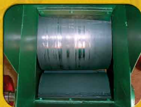
Detalhe do compartimento de entrada dos torrões.